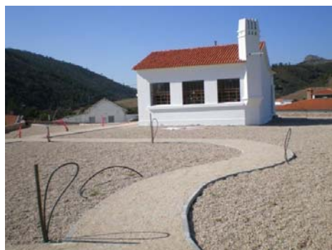
Monfobres: Arranjo urbanístico do Largo da Escola e do Fontanário