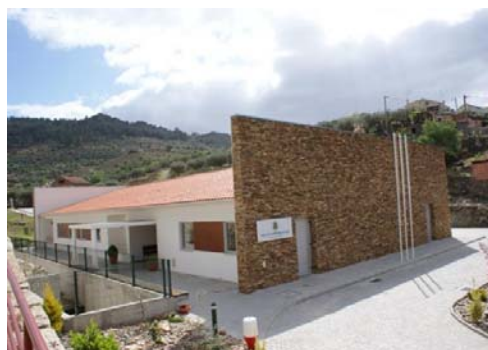
Candedo: Lar da 3ª Idade (Sta. Casa da Misericórdia) e arranjo urbanístico na saída para o Rio Tua