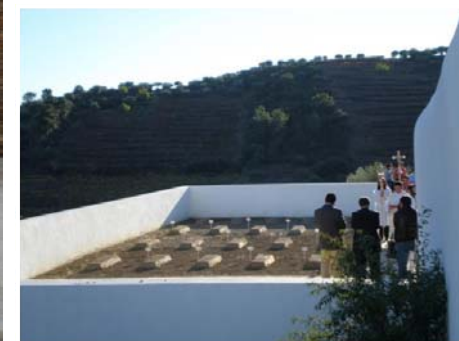
Sobreira: Ampliação do Cemitério / Construção do Largo da Cruz Cobertura do Tanque de Lavar