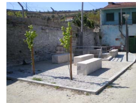
Porrais: Construção da Mini-ETAR / Requalificação da fonte do largo do Terreiro