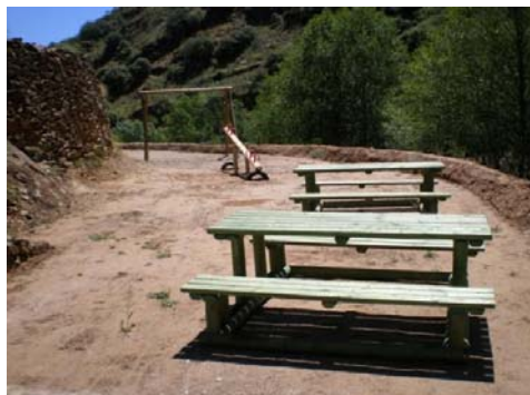
Martim: Construção da Praia Fluvial e reconstrução do Edifício Sede do Grupo desportivo